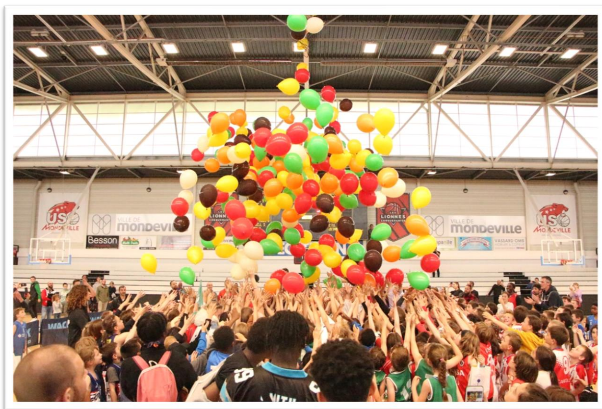
Fête du mini-basket 2022 / 26 mai à Mondeville